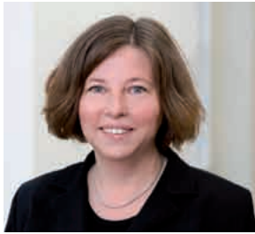
Katrin Lompscher Senatorin für Gesundheit, Umwelt und Verbraucherschutz